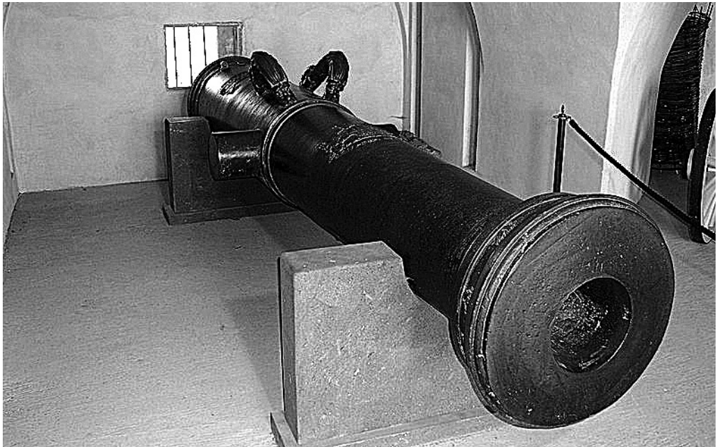
Шарфмеца. XVI ст. Сучасне фото

Скорострільність важкої артилерії була невисокою. Серед іншого це зумовлювалося тим, що такі гармати мали досить довге дуло (його довжину визначали в «ядрах» або «калібрах»), відтак гармаші витрачали чимало часу та зусиль на засипку пороху та закладення ядра у ствольний канал. Приміром, доволі непросто було підготувати до пострілу шарфмеца, яка, за деякими даними, могла мати дуло завдовжки 375 см, масу 6120 кг, заряджалася 100-фунтовим (51 кг) ядром та майже 67 фунтами (близько 34 кг) пороху (співвідношення мас порохового заряду та ядра цієї гармати становило 2:3) 12 . Перш ніж приступити до заряджання важкої гармати, обслузі потрібно було охолодити розпечене після пострілу дуло, а також прочистити його від порохового нагару.