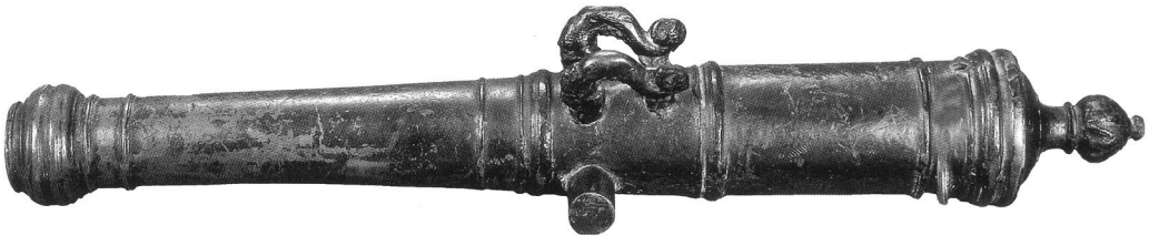
30-міліметрова лита мідна гармата з довжиною ствола 62,5 см. XVII ст.

Якщо виходити з припущення, що в кожен із 12 козацьких возів, якими перевозили порох і ядра, впрягали по чотири коня, то їх було 48. Скільки потрібно було коней для перевезення запорозьких гармат? Як уже зазначалося, під Хотином козаки мали 23 гармати, причому всі – невеликого калібру (у джерелах про них згадано як про «дріб'язок») 41 . Серед них напевно були й такі, що їх перевозили по декілька одиниць на одному возі. Якщо абстрагуватися від цього припущення та, аби не применшити чисельність табуна запорожців, закріпленого за «арматою», виходити із засновку, що кожен козацьку гармату перевозили окремо на лафеті (або на возі) не менше, аніж двома кіньми (зазначимо, що легкі польові гармати турки перевозили лише одним конем) 42 , то всіх коней для транспортування гармат налічувалося 46. Отже, разом із кіньми, які перевозили порох та ядра, артилерійський табун запорожців мав би становити, згідно з даними «Реєстру полковників Війська Запорозького на турецьку експедицію під Хотин у 1621 році», щонайбільше сотню коней. Якщо це так, то які функції виконували приписані до козацької артилерії ще близько двох сотень коней? Звісно, що всі вони не могли бути лише резервним (змінним) гарматним тяглом. Як видається, ці коні перевозили різноманітну амуніцію, а також порох і ядра.