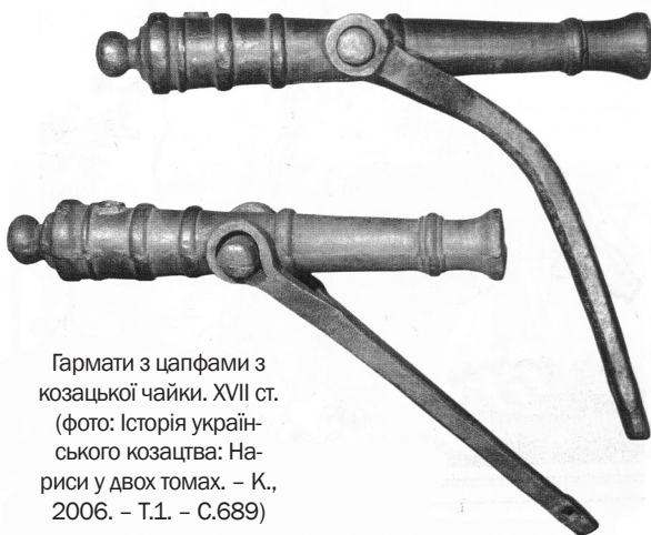
Гармати з цапфами з козацької чайки. XVII ст.

Як свідчать деякі джерела, а саме «Реєстр полковників Війська Запорозького на турецьку експедицію під Хотин у 1621 році», козацьке військо, що прибуло до місця битви з 23 гарматами, явно не було переобтяжене ані порохом, ані ядрами, оскільки весь його боєзапас легко вмістився на 12 возах 39 . Такої кількості запряжених четвіркою коней возів із порохом та ядрами вистачило б лише одній великій