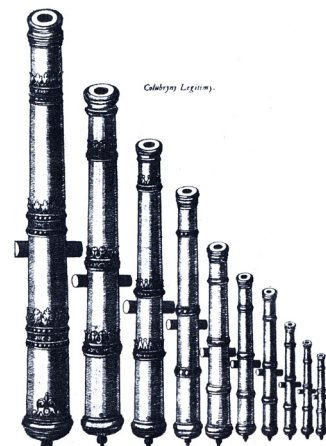
Довгоствольні гармати типу колобрини. Гравюра з артилерійського трактату першої половини XVII ст.

Одночасно набули поширення ще менші гармати – польові або полкові. Причому особливу увагу звертали саме на зменшення їх ваги. Через це,