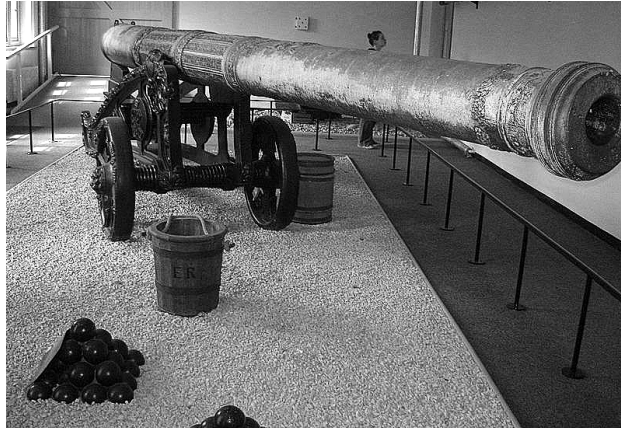
Василіск. Сучасне фото

Для прикриття перекинутої на лівий берег Дністра артилерії османське командування виділило чималі сили – майже 10-тисячний корпус турецької й татарської кінноти. Частина цих вояків розсосередилася, ставши неподалік від батарей, а решта під прикриттям густого туману розмістилася напготові на певній відстані. Пізніше ці підрозділи виконували самостійні бойові завдання, не обмежуючись