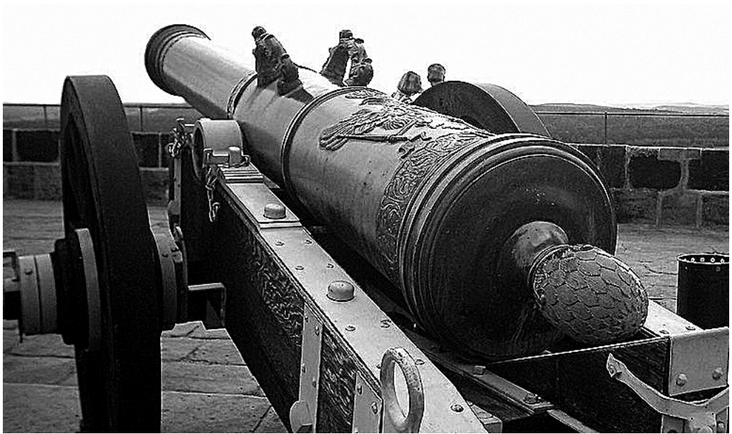
Картауна. Сучасне фото

приміром, у шведській армії замість бронзових почали відливати гармати із заліза. Трифунтова залізна гармата калібру 79 мм мала дуло завдовжки 15 калібрів і важила лише 625 фунтів, тобто близько 318 кг. Маса дула картауни сягала 3250 кг, напівкартауни – 2250 кг, чвертькартауни – 1370 кг, октави – 1070 кг 13 .