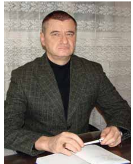
Генерал-майор Олександр ШИКОТОВСЬКИЙ (Начальник ГУОС з 3 грудня 2004 по 27 жовтня 2005 р.)

— Так. Крім того, передбачається її суттєве удосконалення. Ми розуміємо, що для забезпечення якісного функціонування нової системи кадрового забезпечення на першому місці має бути системна підготовка (перепідготовка) службових осіб кадрових органів усіх рівнів. Вже запроваджена курсова підготовка окремих категорій військовослужбовців на перших центральних офіцерських курсах у Миколаєві. Цього року розпочата підготовка керівників кадрових органів на базі Національної академії оборони України. Зрозуміло, ми знаходимося на початку важкого та тернистого шляху, який спрямований на досягнення якісно нового рівня кадрового забезпечення військ та створення належних умов для формування необхідного потенціалу Збройних Сил — професіоналів нового покоління.