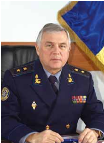
Генерал-лейтенант Володимир АРТЮХ (Начальник ГУОС з травня 2007 по січень 2009 р.)

— Хотілося б помилитися, але маю сумніви, що всі офіцери підпишуть наступний контракт. І в першу чергу це стосується тієї категорії, яка вже набула необхідного для отримання пенсії терміну служби. І в цьому немає нічого дивного. Адже у військах офіцери не бачать перспектив перебування на військовій службі: «пробуксовує» соціальний захист, грошове забезпечення військовослужбовців навряд чи можна вважати задовільним, не належним чином вирішуються проблеми забезпечення військових житлом. Тож сьогодні питання збереження офіцерського корпусу має бути пріоритетним як для командирів всіх ланок, так і кадрових органів Збройних Сил України.