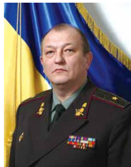
Генерал-майор Сергій КРОПИВЧЕНКО (Начальник ГУОС з жовтня 2009 р. по теперішній час)

У січні 2010 року Управління відзначило п'яту річницю від дня свого заснування, а напередодні своїми спогадами та баченням перспектив подальшої діяльності з кореспондентом часопису поділилися воєначальники Збройних Сил України, які очолювали Головне управління особового складу Генерального штабу Збройних Сил України в різні роки.