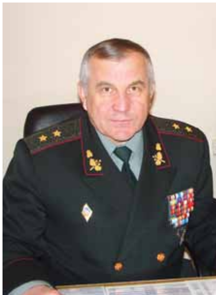
Генерал-лейтенант Анатолій ПУШНЯКОВ (Начальник ГУОС з 10 березня 2006 по 27 квітня 2007 р.)

І тим приємніше мені констатувати, що в процесах, пов'язаних з кадровим забезпеченням, останніми роками спостерігаються позитивні зміни. Але не слід забувати, що в такій галузі, як кадри, необхідний постійний розвиток форм та методів роботи, оптимізація кадрових структур тощо. Разом з тим, для вирішення цих завдань доцільно, поряд із застосуванням власного досвіду, вивчати та втілювати в життя досвід зарубіжних колег. На мій погляд, значним кроком вперед у роботі з кадрами може стати впровадження централізованого кадрового менеджменту та створення кадрових центрів у Збройних Силах і, звичайно, перехід до комплектування армії на професійній основі. Однак форсування цього процесу, який сьогодні матеріально не забезпечений, може призвести до небажаних наслідків.