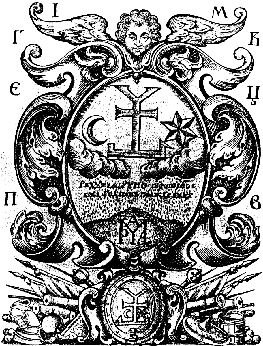
Герб Івана Мазепи