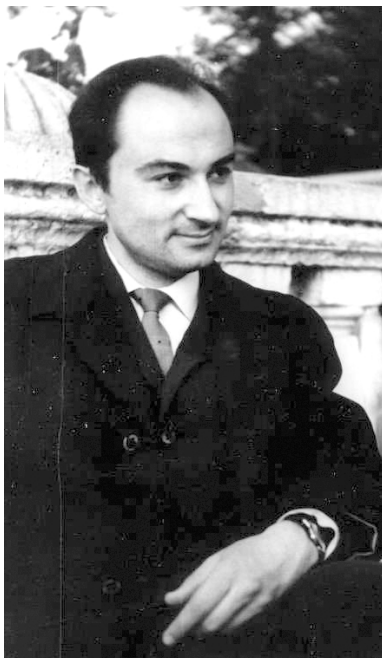
Київ, 1968 р.