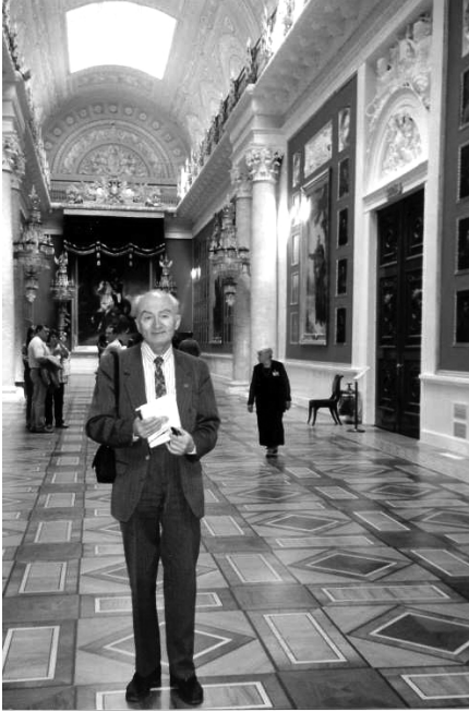
В одному із залів Державного Ермітажу. Санкт-Петербург, 2005 р.