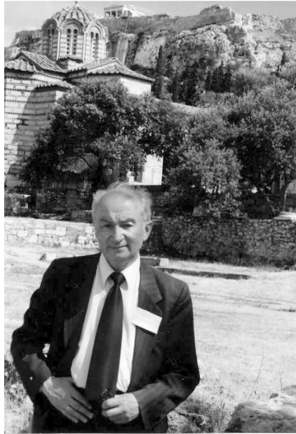
На конференції в Афінах. Травень 2005 р.