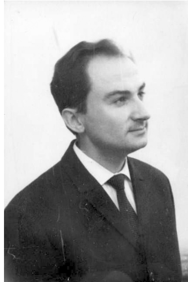
Аспірант Державного Ермітажу. Ленінград, 1963 р.