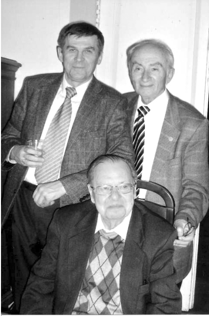
З академіком РАН В. Л. Яніним та академіком РАН П. Г. Гайдуковим на конференції, присвяченій 100-річчю І. Г. Спаського. Санкт-Петербург, березень 2004 р.