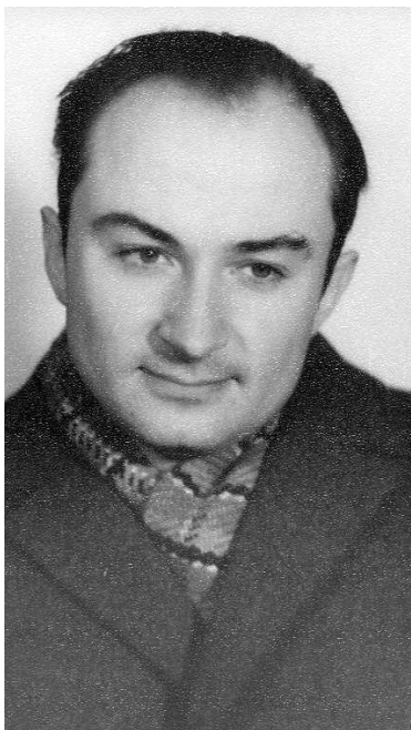
Київ, 1967 р.