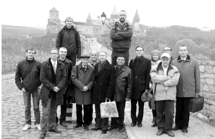
З учасниками III Міжнародної наукової конференції «Україна і Велике князівство Литовське в XIV–XVIII ст.: політичні, економічні, міжнаціональні та соціокультурні відносини у загальноєвропейському вимірі». Кам'янець-Подільський, 2013 р.