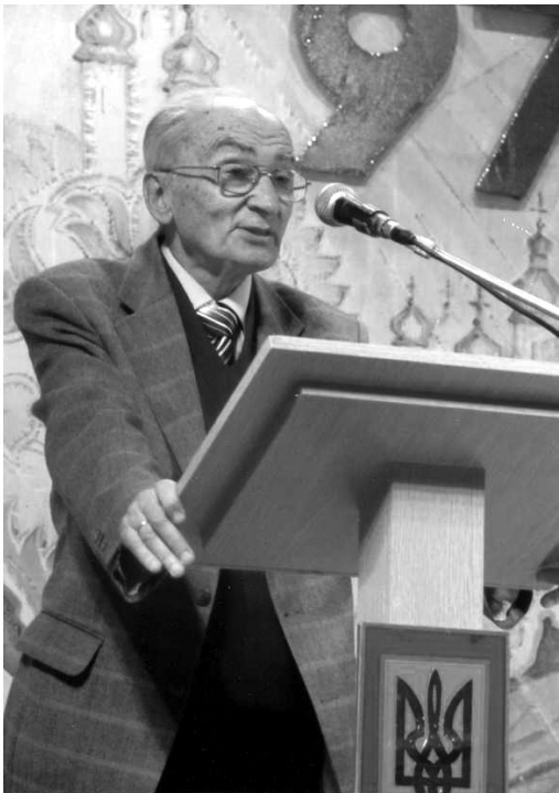
На конференції з нагоди 975 річниці Спасо-Преображенського собору у Чернігові. Чернігів, 2011 р.