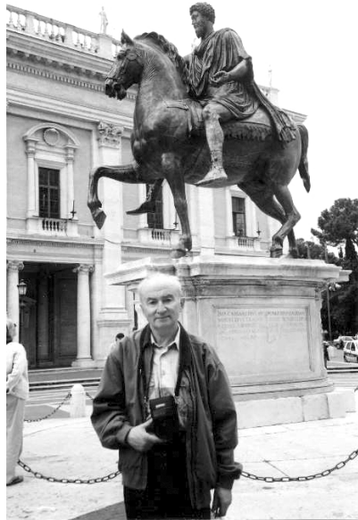
Біля кінного монументу Марку Аврелію. Рим, травень 2006 р.