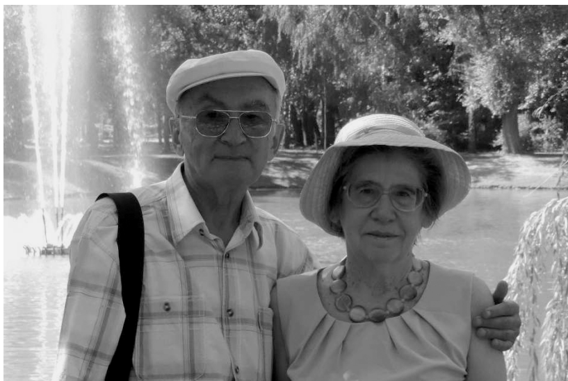
З дружиною. Київ, 2013 р.