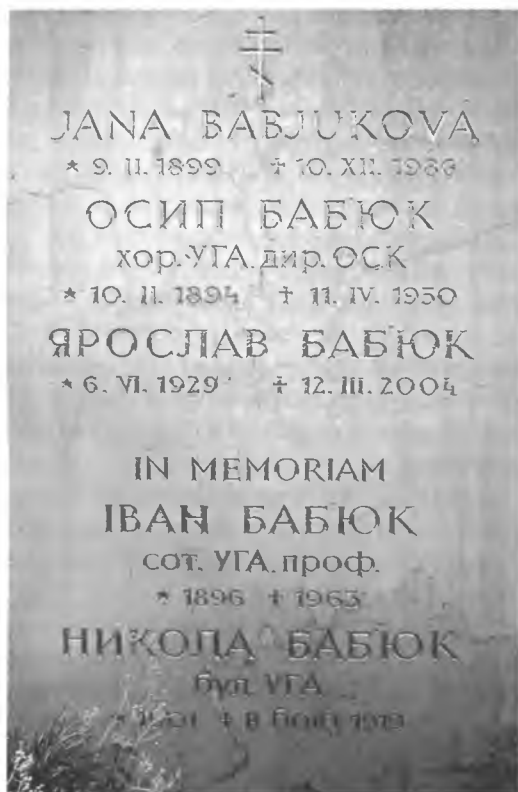
Надмогильна дошка на Ольшанському цвинтарі у Празі.