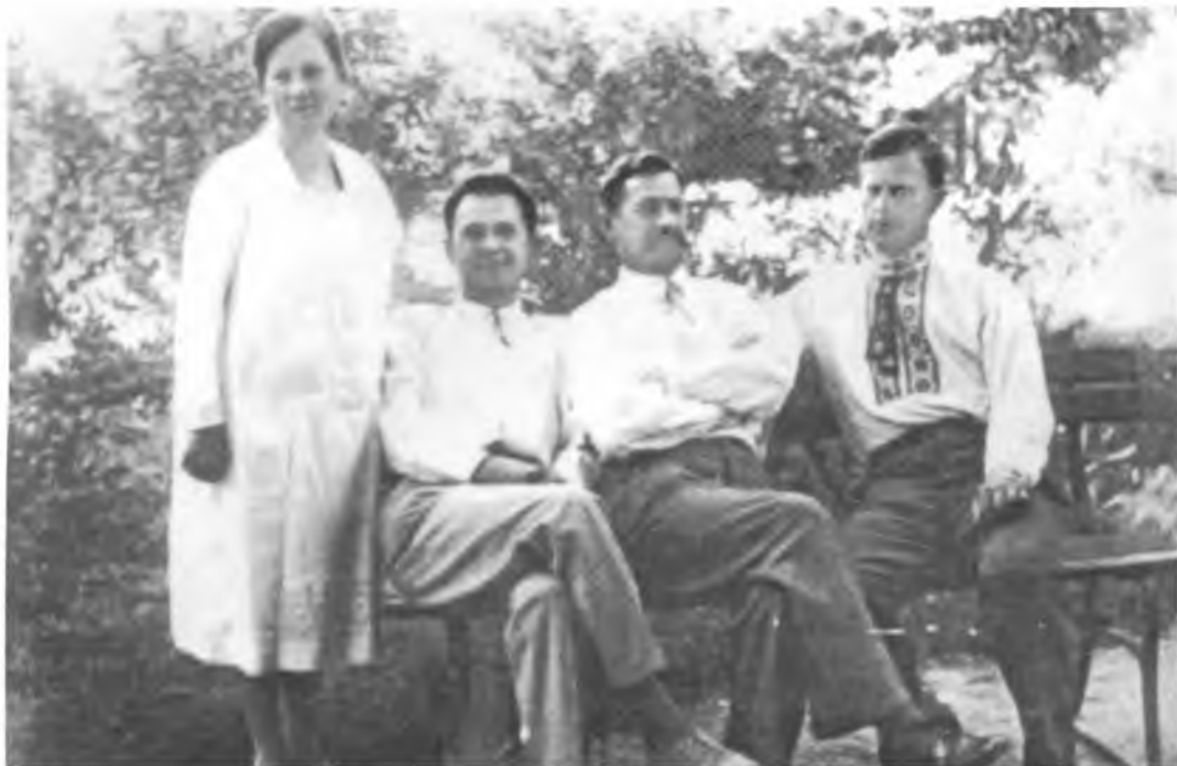
Родина Гайдовських-Потаповичів. Подєбради, 1929 р.

рогів-окупантів як охотник (доброволець. — Ред. )”. У 1919 р. перебував на службі в міністерстві фінансів уряду УНР, з яким й емігрував за кордон. Дійсний слухач економічного відділу економічно-кооперативного ф-ту УГА в Подєбрадах (1922 — 1926). Захистивши дипломну роботу “з успіхом добрим”, здобув фах інженера-економіста (1927).