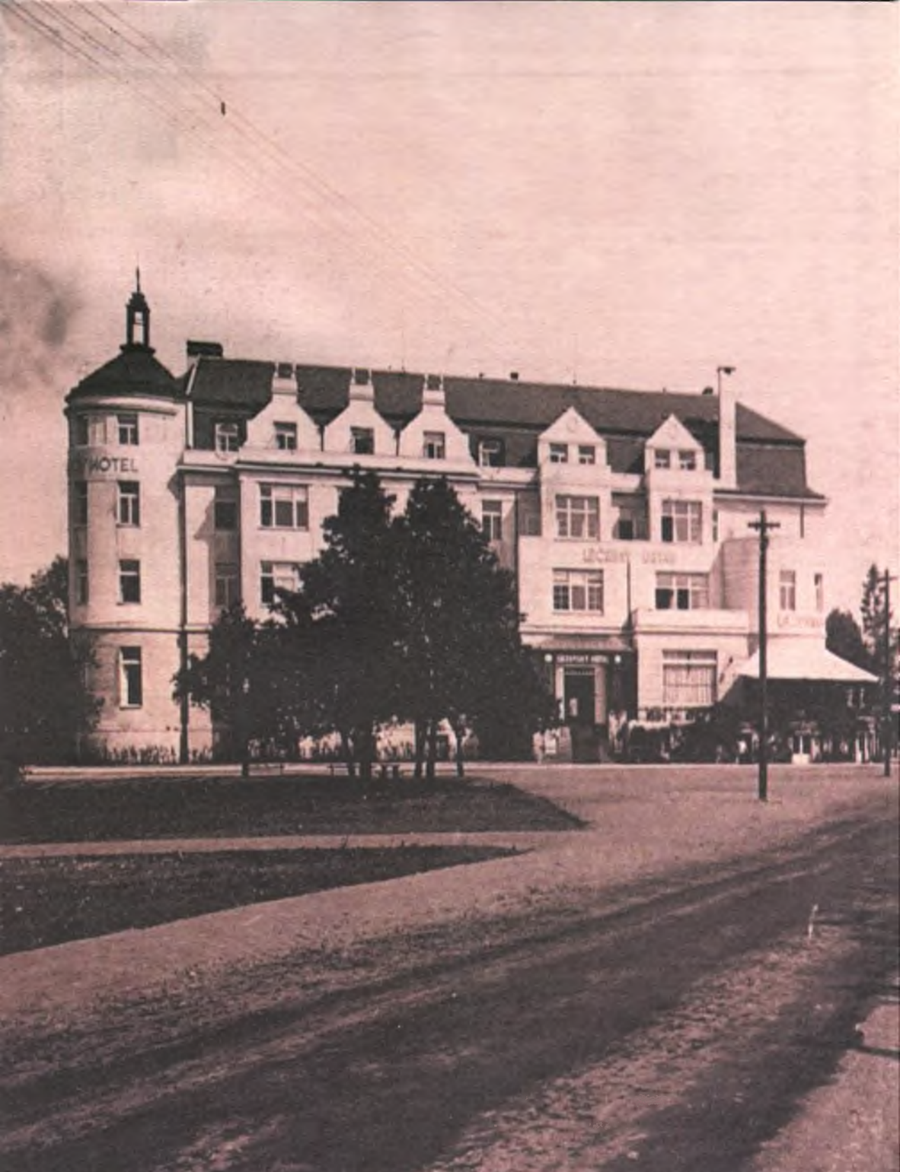
LÁZNĚ PODĚBRADY: LAZEŇSKÉ BUDOBY.