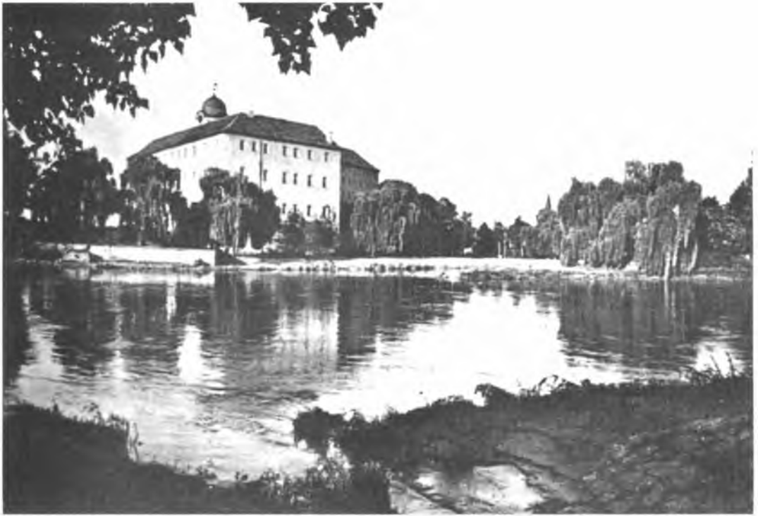
Подєбрадський замок — осідок Української господарської академії. Вигляд з боку річки Лаби. Подєбради, поч. 1920-х рр.