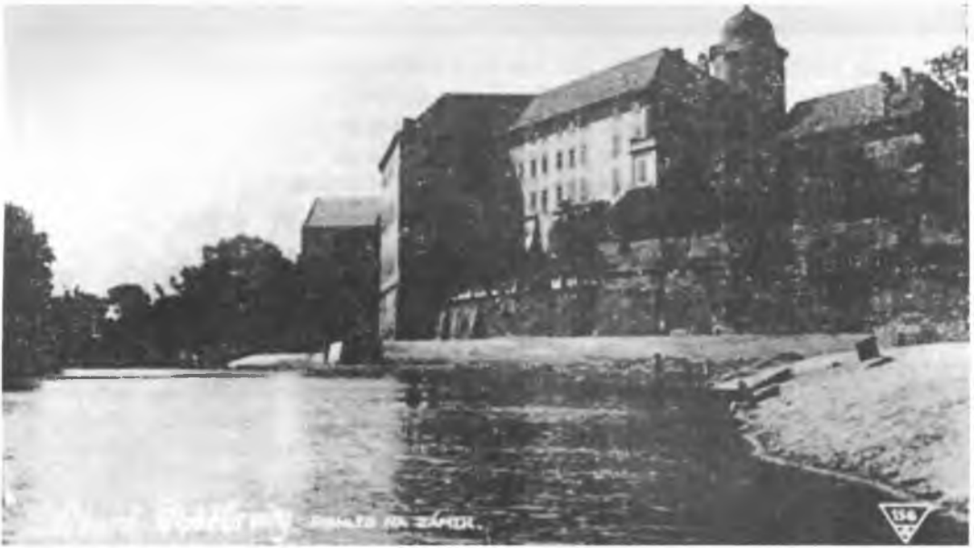
Подєбрадський замок і річка Лаба. Подєбради, 1922 р.