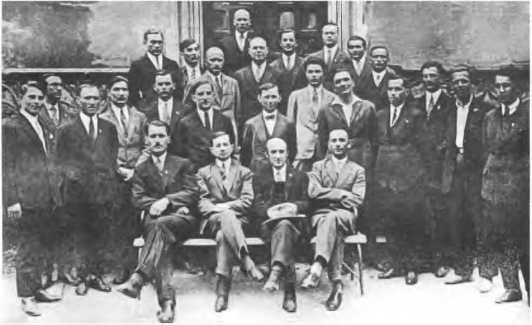
Козаки і старшини 3-ї Залізної дивізії Армії УНР, студенти Української господарської академії. Подєбради, 1920-ті рр.