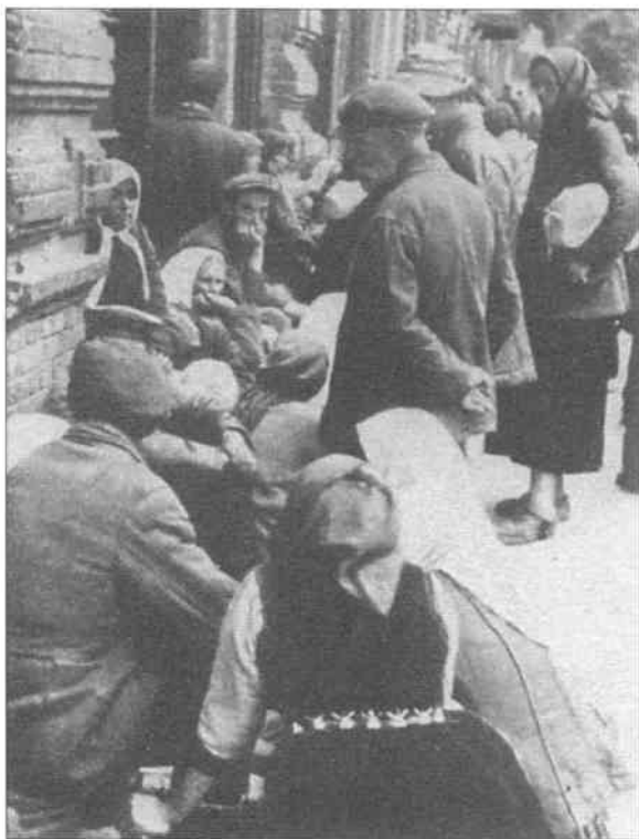
Черга біля магазину системи торгзіну в Києві. 1933 р.