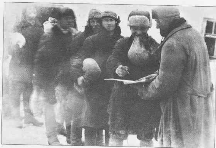
Розподіл пшона за трудоднями в колгоспі ім. Д. Бедного. Село Удачне Гришинського району Донецької області. Початок 1930-х рр.