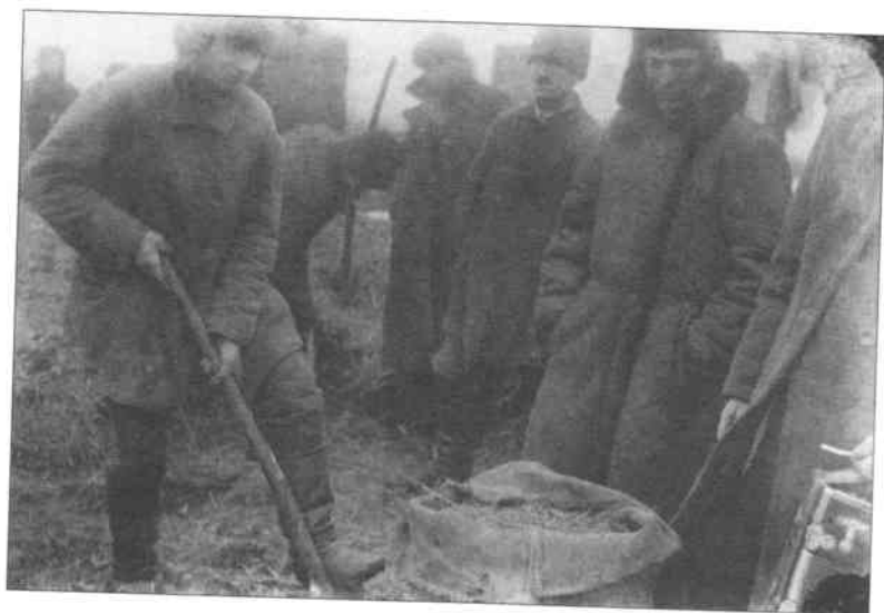
Вилучення активістами прихованого хліба. Село Удачне Гришинського району Донецької області. Початок 1930-х рр.