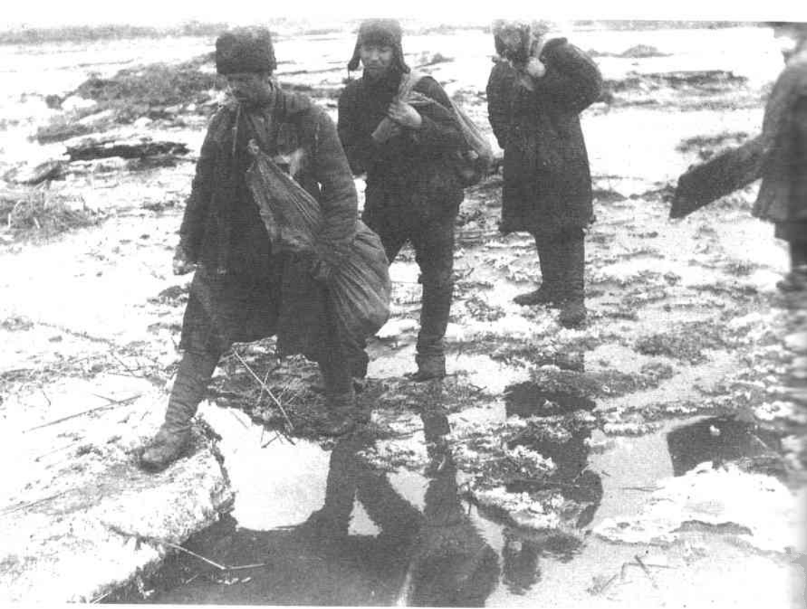
Селяни-мішечники в пошуках хліба. Початок 1930-х рр.