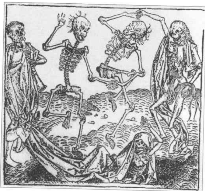
Листівка «Селяне, не давайте хліба більшовикам!» 1932 р.