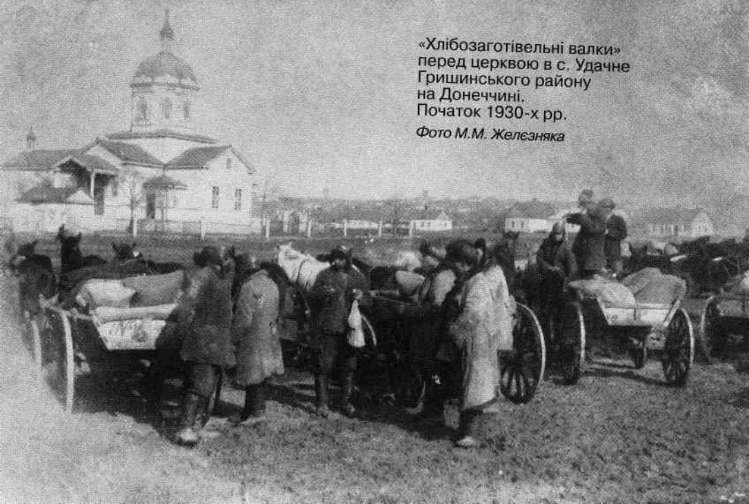
«Хлібозаготівельні валки» перед церквою в с. Удачне Гришинського району на Донеччині. Початок 1930-х рр.