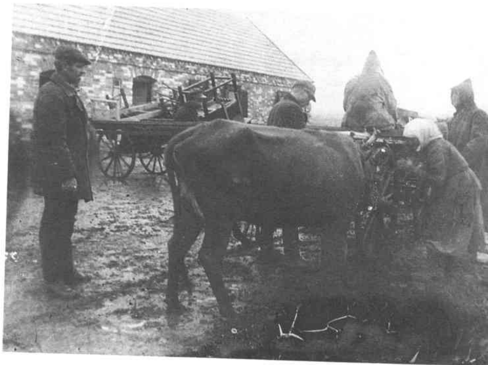
Конфіскація майна та худоби в с. Удачне Гришинського району на Донеччині. Початок 1930-х рр.