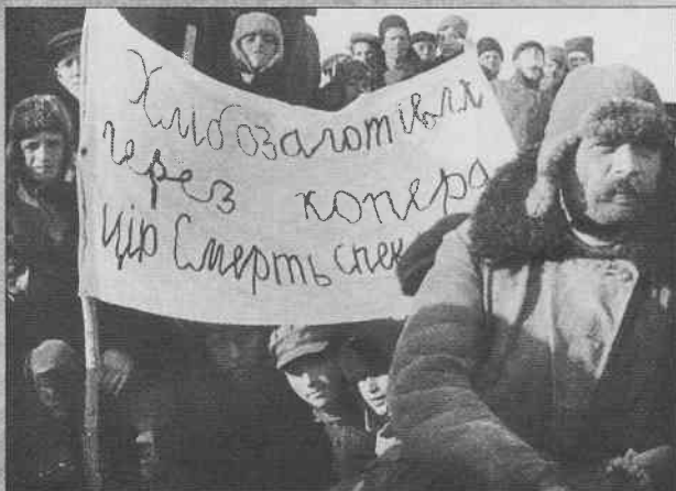
Виконання хлібозаготівель в с. Ільїнці Вінницької області. 1929 р.