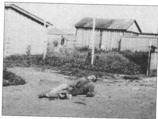
Жертви голоду. Харків. 1933 р.