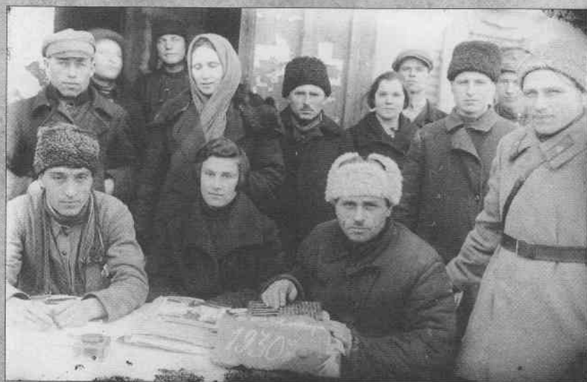
Активісти Удачнянської сільради Гришинського району на Донеччині. 1930 р.