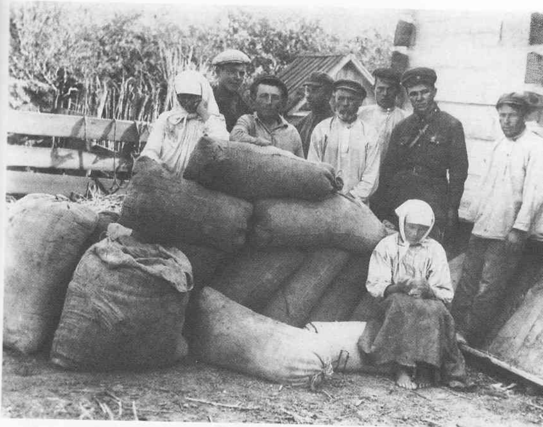
«Твердоздавці». Вилучення хліба в с. Удачне Гришинського району на Донеччині в роки голоду.