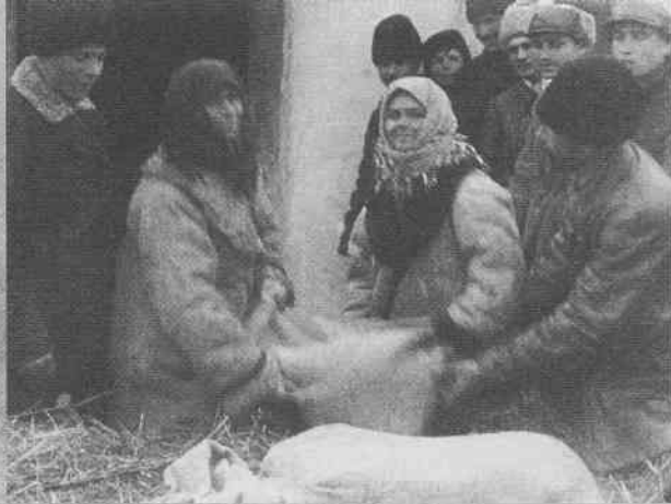
Хлібозаготівлі в с. Крушельці Вінницького району. Жовтень 1931 р.