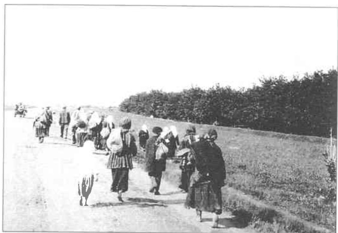
Голодні селяни залишають села в пошуку їжі в містах. 1933 р.