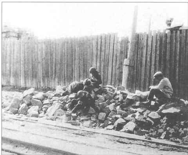
Голодуючі діти на вулицях Харкова в пошуках їжі. 1933 р.