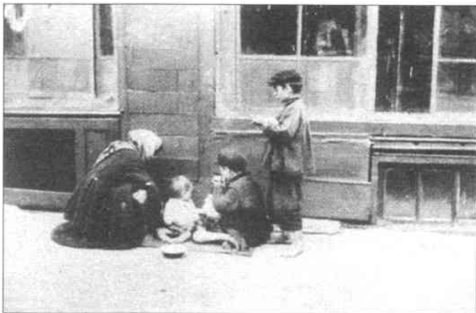
Жінка-селянка з дітьми – біженці з села. Київ. 1933 р.