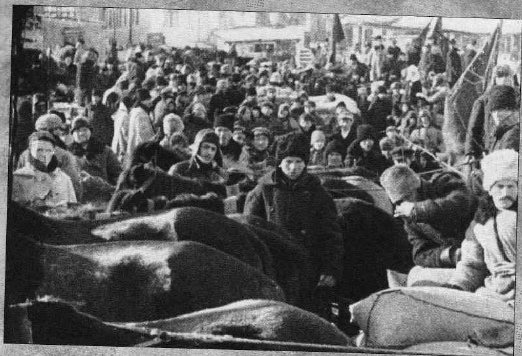
Виконання державного хлібозаготівельного плану в с. Ільїнці Вінницької області. 1929 р.