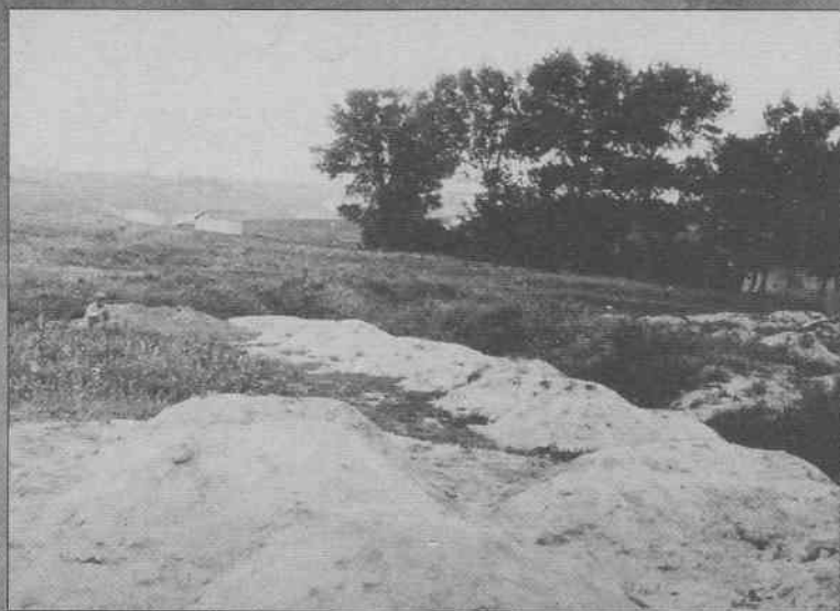
Масове поховання полеглих від голоду на Харківщині. 1933 р.