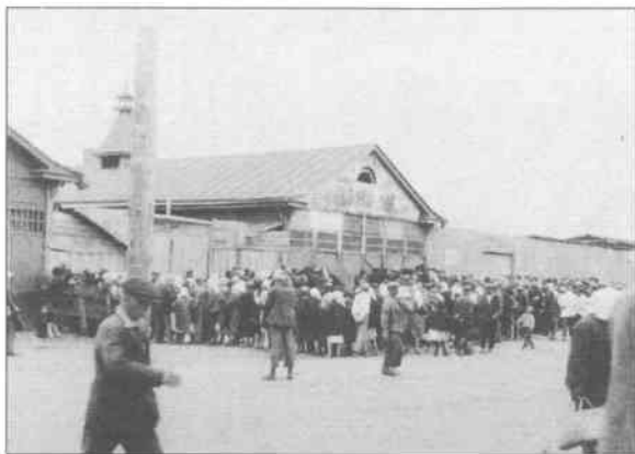
Черги за хлібом до магазинів системи торгзіну в Харкові. 1933 р.