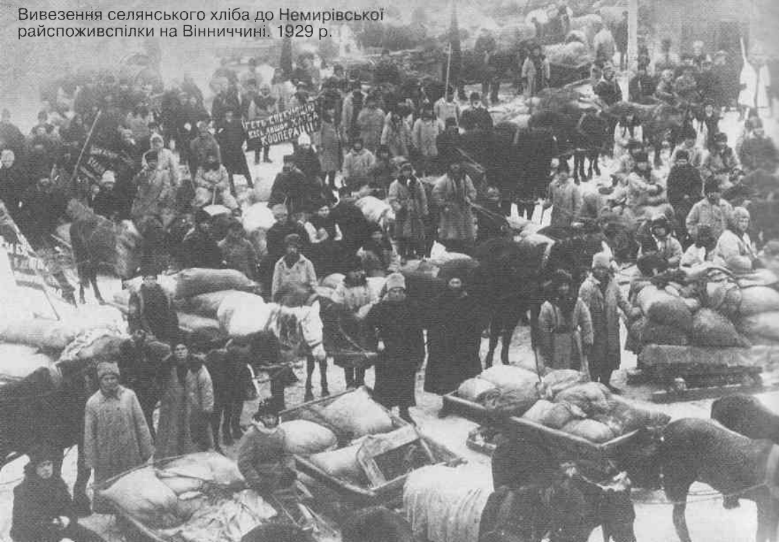
Вивезення селянського хліба до Немирівської райспоживспілки на Вінниччині. 1929 р.