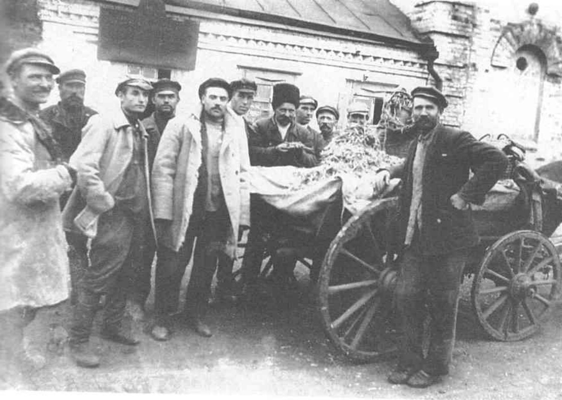
Арешт селянина за збір колосків на колгоспному полі. Село Удачне Гришинського району Донецької області. Осінь 1932 р.