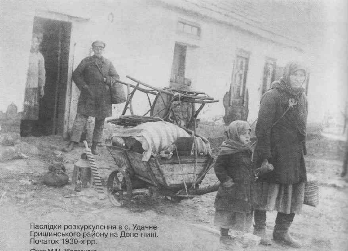
Наслідки розкуркулення в с. Удачне Гришинського району на Донеччині. Початок 1930-х рр.