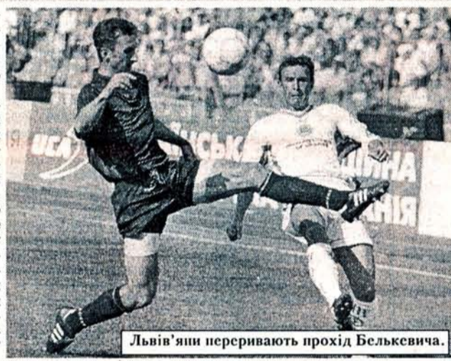
Львів'яни переривають прохід Белькевича.

Чого вартий один стрижневий гравець у команді — розум і єш тільки тоді, коли його немає. Уже на початку першого тайму через пошкодження змушений був залишити поле капітан "Карпат"