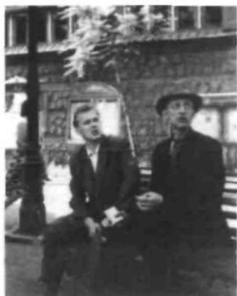
Член Центрального проводу ОУН Михайло Степаняк (праворуч, оперативна зйомка 1960-х рр.)