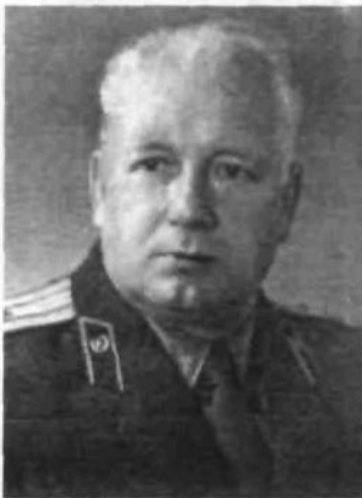
Начальник 5 Управління КДБ УРСР полковник Леонід Калаш