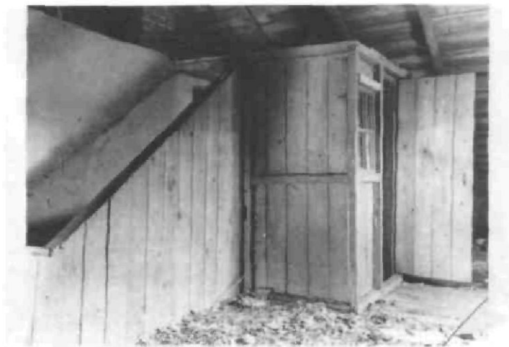
Вхід до тайника, де переховувався Р. Шухевич (тогочасний вигляд, друкується вперше)