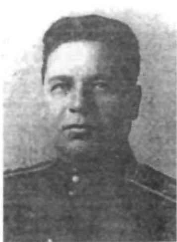
Нарком внутрішніх справ УРСР Василь Рясной