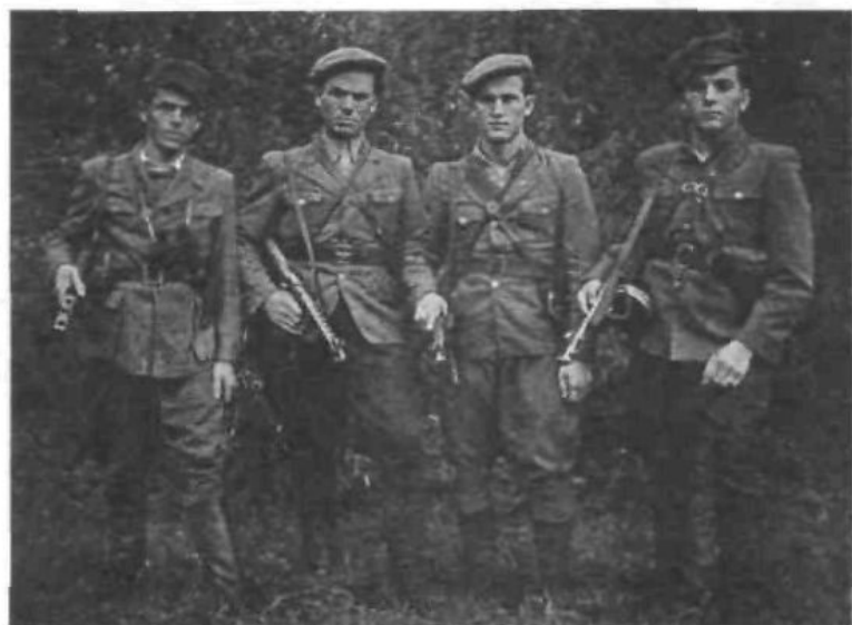
Підрозділ військово-польової жандармерії УПА