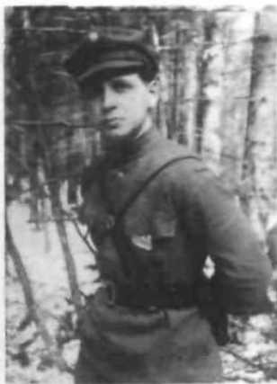
Шеф референтури пропаганди Центрального проводу ОУН Петро Федун («Полтава», кінець 1940-х рр.)