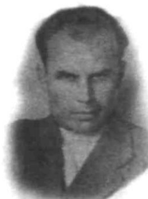
Яков Бусол («Галина»), воєначальник УПА. (друкується вперше)