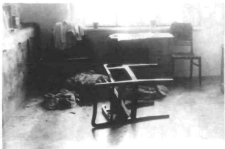
На місці вбивства письменника Ярослава Галана (24 жовтня 1949 р.)