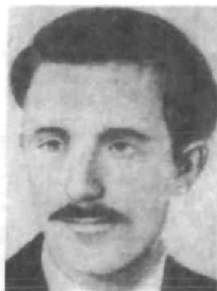
Воєначальник УПА Дмитро Грицак («Перебийніс»)