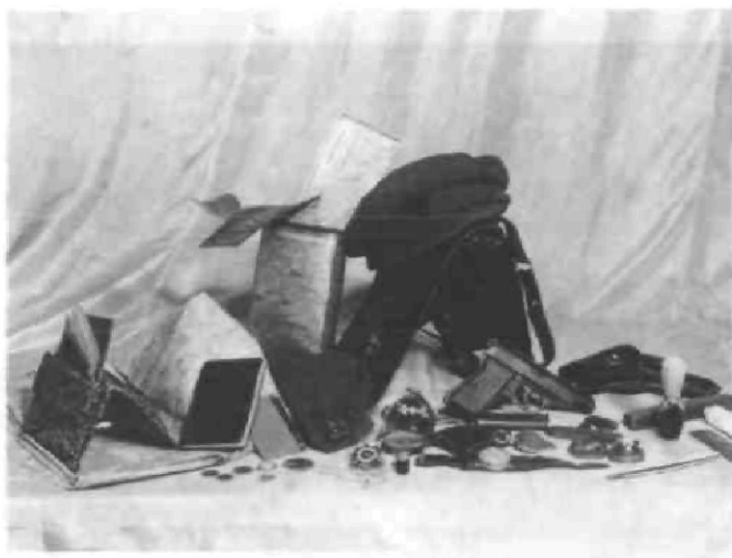
Зброя та особисті речі Р. Шухевича (друкується вперше)