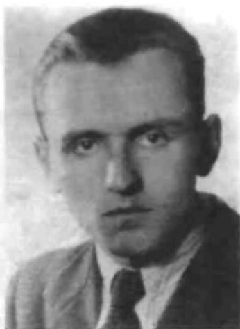
Василь Кук — керівник підпілля ОУН на Сході України