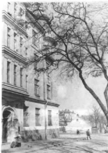
Будинок по львівській вулиці О. Невського, 2, де знаходилася одна з конспіративних квартир Центрального проводу ОУН (друкується вперше)