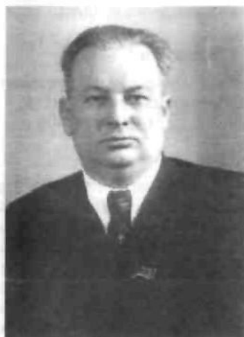
Голова КДБ при РМ УРСР генерал-майор Віталій Нікітченко