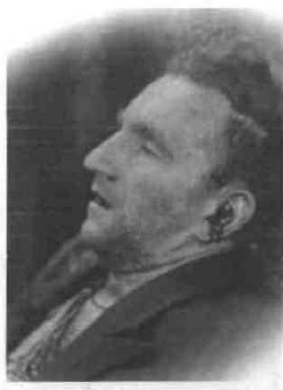
Посмертне фото Р. Шухевича (5 березня 1950 р.)