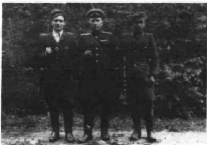
Офіцер МДБ з учасниками спецгрупи (Станіславська обл., 1951 р.) (друкується вперше)