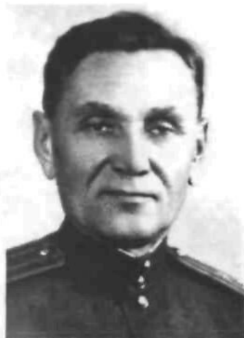
Полковник Сергій Карін- Даниленко, перший керівник Оперативної групи НКДБ по Західній Україні