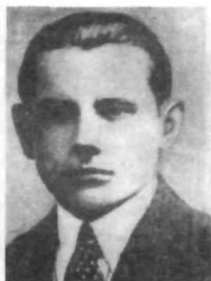
Шеф Головного військового штаба УПА Олекса Гасин («Лицар»)