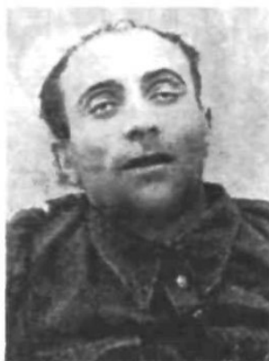
Радянська листівка з фото вбитого Дмитра Клячківського («Клима Савура»)