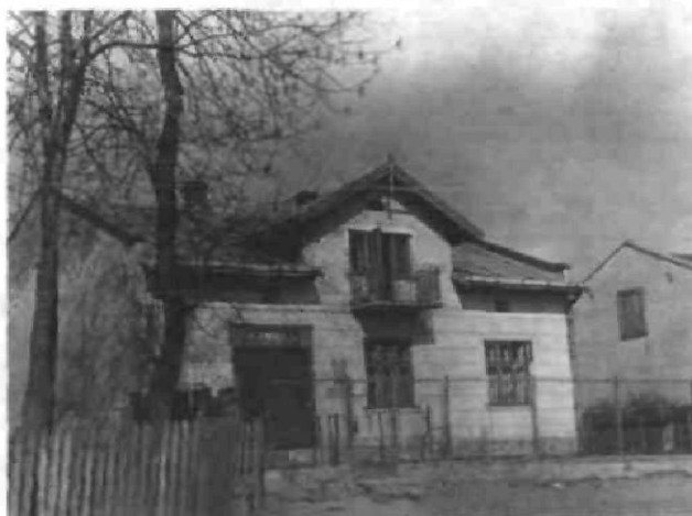
Дім в Білогорці, де переховувався Р. Шухевич (тогочасний вигляд, друкується вперше)