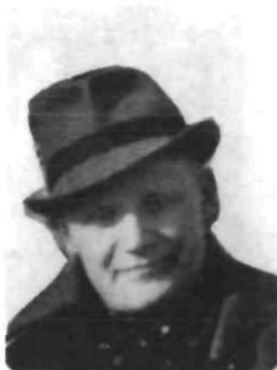
Крайовий провідник ОУН Роман Кравчук («Петро»)