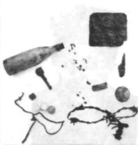
Знаряддя ексекуюції СБ ОУН (з місць ексгумації жертв 1958–1959 рр.)