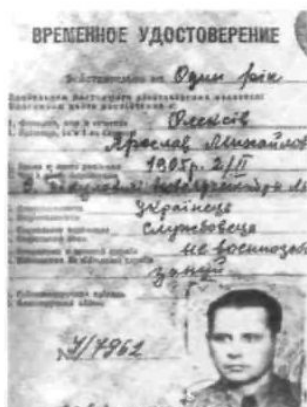
Фіктивний паспорт Олекси Гасина