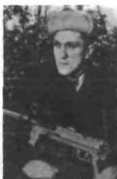
Командувач УПА на Закарпатті Ярослав Старух («Стяг»)