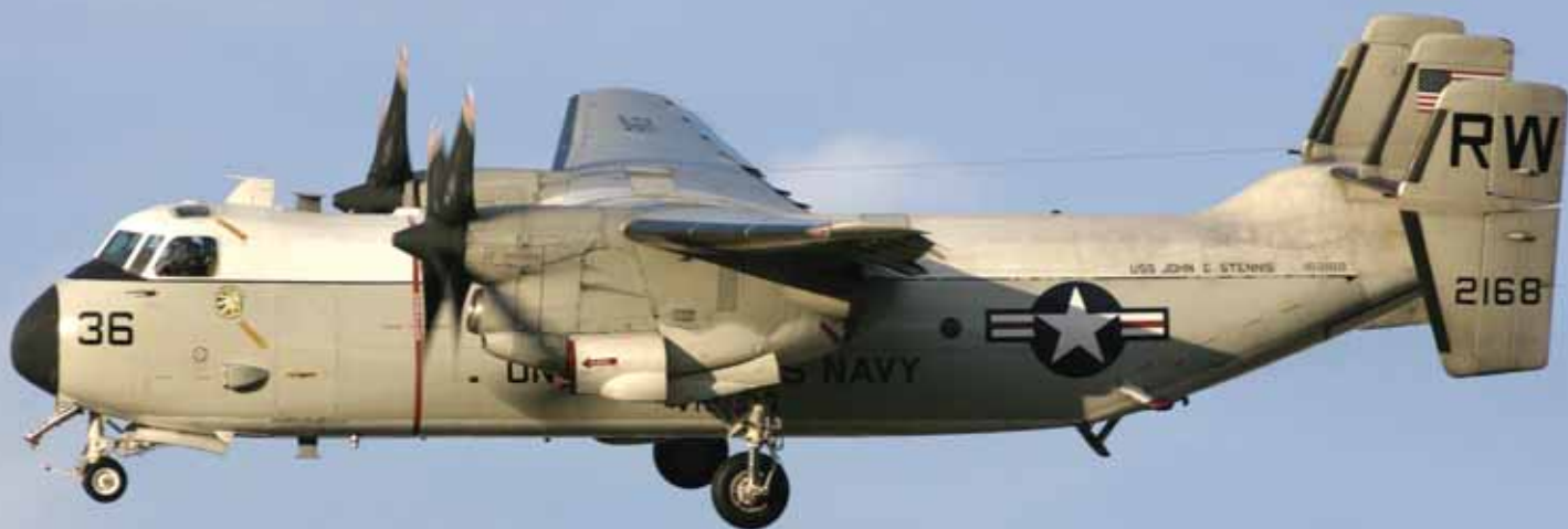
ПАЛУБНИЙ ТРАНСПОРТНИЙ ЛІТАК С-2А «GREYHOUND» (США)