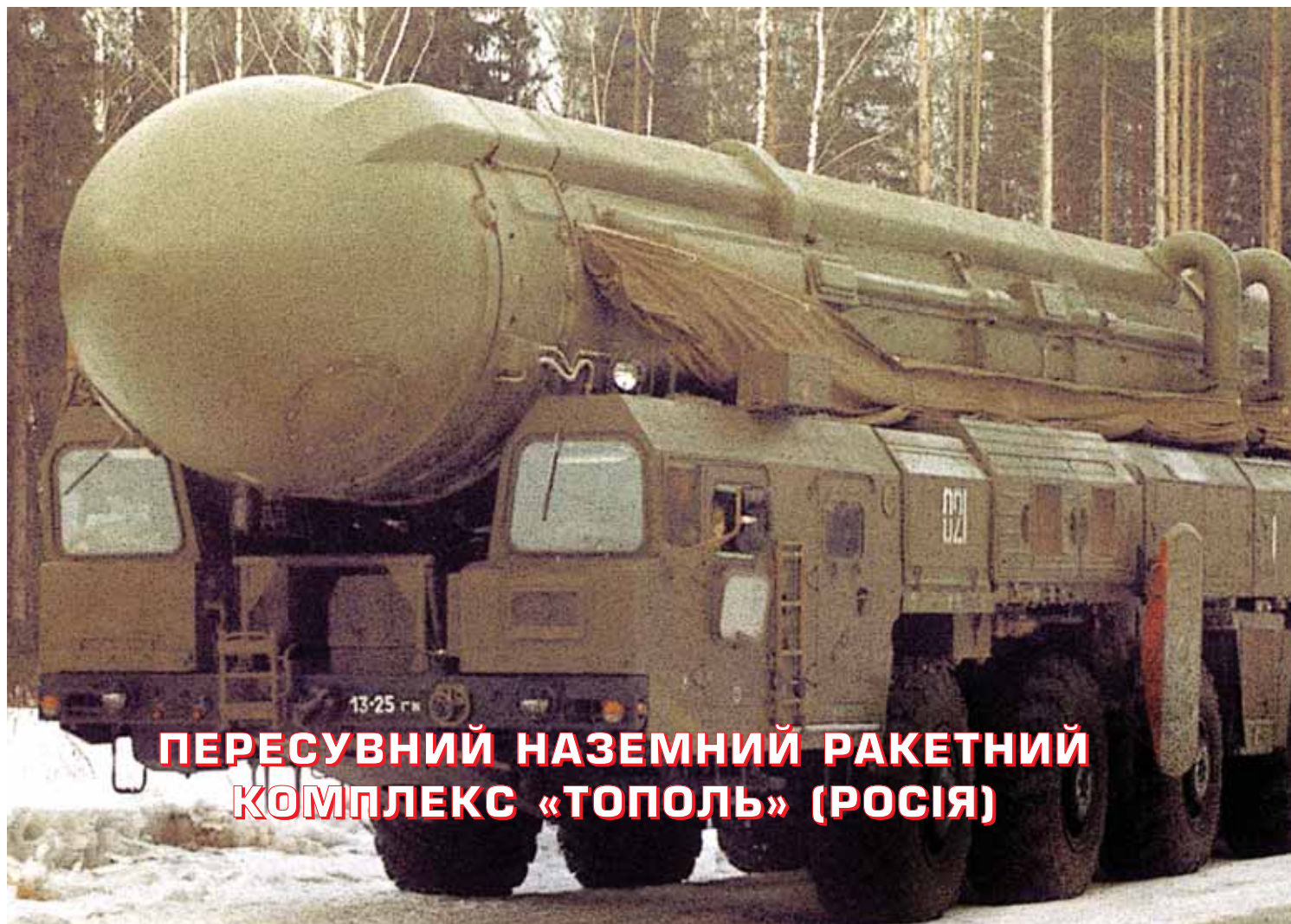
ПЕРЕСУВНИЙ НАЗЕМНИЙ РАКЕТНИЙ КОМПЛЕКС «ТОПОЛЬ» (РОСІЯ)