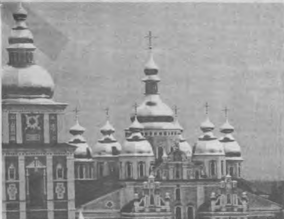
Михайлівський золотoverхий собор

1989 р. почали створюватися перші ініціативні групи з відродження Української автокефальної православної церк-